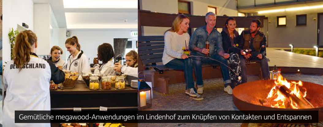
Gemütliche megawood-Anwendungen im Lindenhof zum Knüpfen von Kontakten und Entspannen