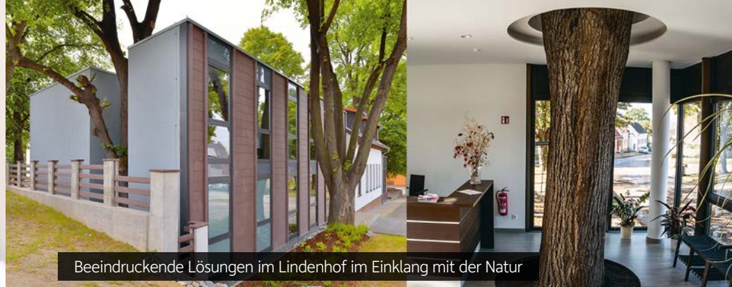
Beeindruckende Lösungen im Lindenhof im Einklang mit der Natur

Der Lindenhof ist das Domizil für Besucher unseres Unternehmens, für Teilnehmer an Seminaren und Tagungen. Sie treffen hier auf die Einsatzvielfalt und oft unerwartete Formgebung des bearbeiteten Werkstoffes. Empfangen vom warmen Eindruck der Fassadenverkleidung, begrüßt vom Türgriff am Haupteingang, erkennen Sie, dass Stühle, Tische, Schränke und Schlafmöbel in überzeugendem Design aus megawood® gefertigt wurden. Das dafür kein Baum gefällt wird, symbolisieren die umbauten Linden im Eingangs- und Saunabereich eindrucksvoll. Lassen Sie sich während Ihres Aufenthaltes im Lindenhof von den Einsatzmöglichkeiten faszinieren.